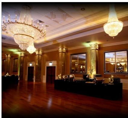
Gran Balloon Room

* Descuento acumulable aplicable hasta 1 de abril 2015. Plazas limitadas.