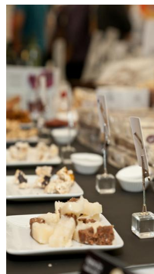
Imágenes Savbor Iberica, edición 2014